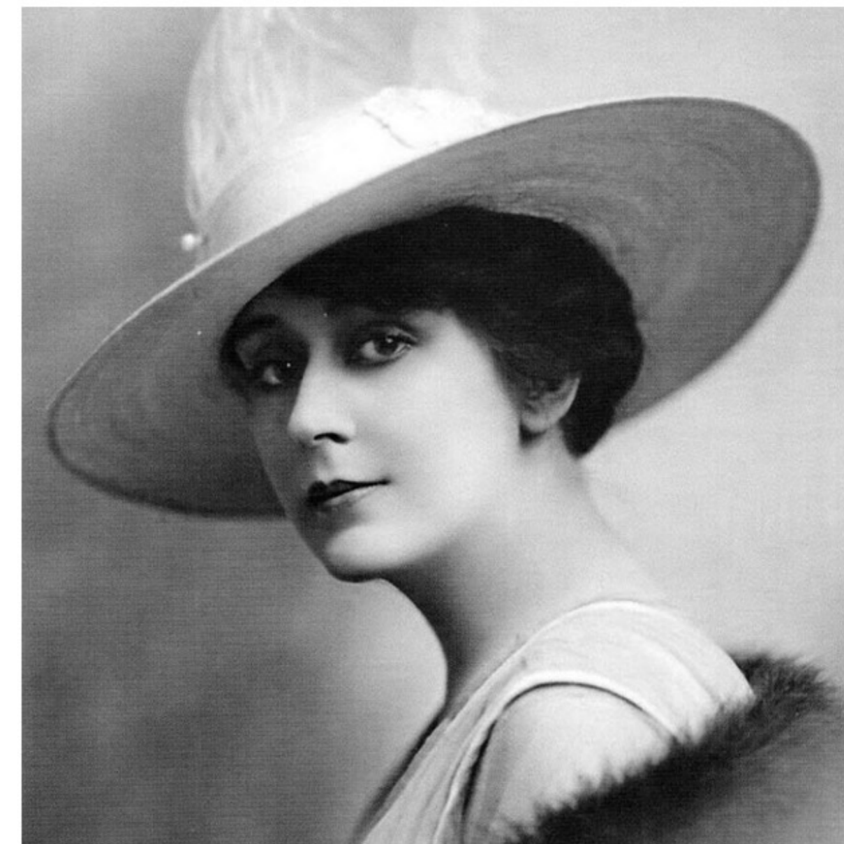
Olga Petrova - nome d'arte di Muriel Harding (1884 -1977)