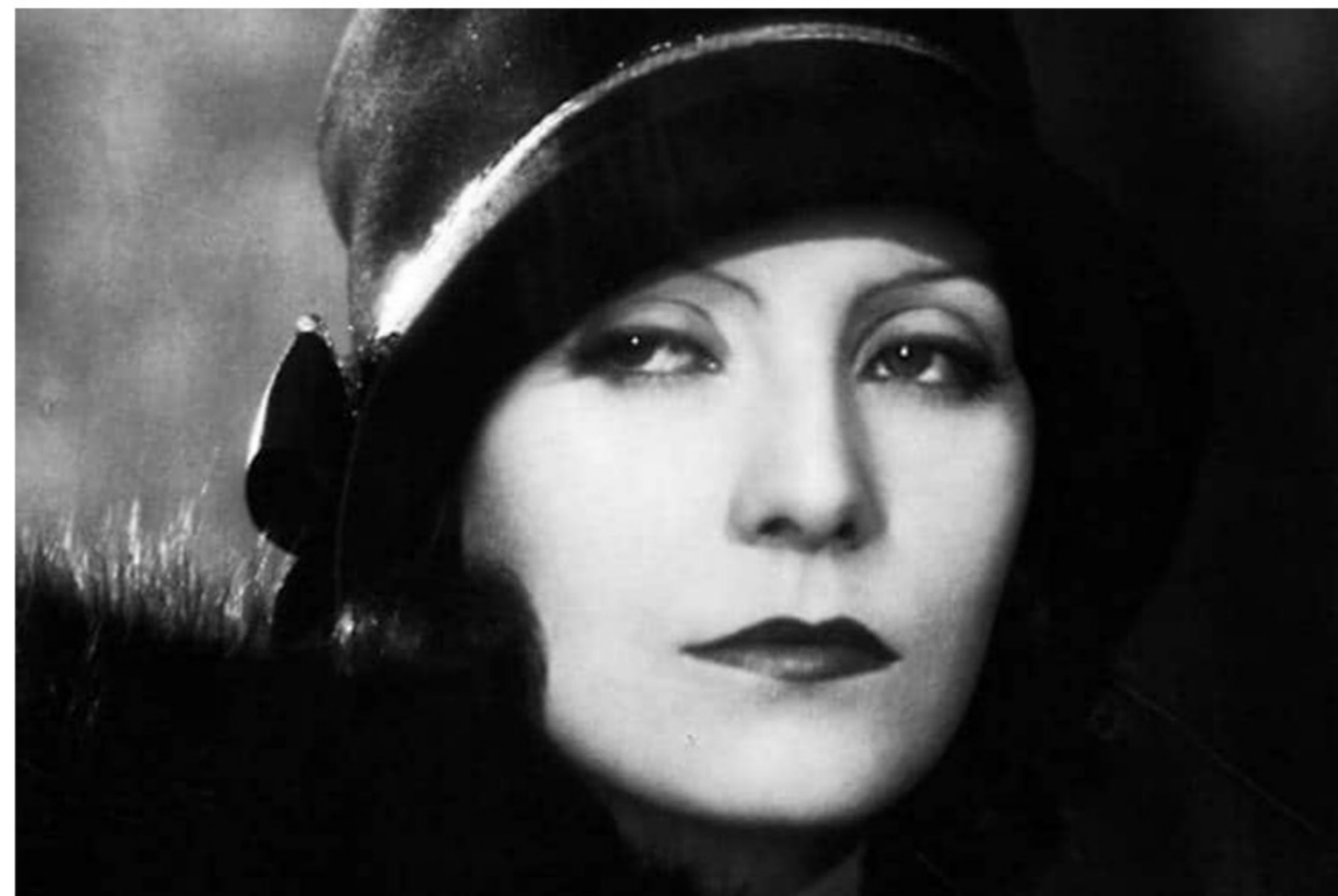
Greta Garbo - nome d'arte di Greta Lovisa Gustafsson (1905 -1990)

La via senza gioia (Die freudlose Gasse), regia di Georg Wilhelm Pabst (1925)