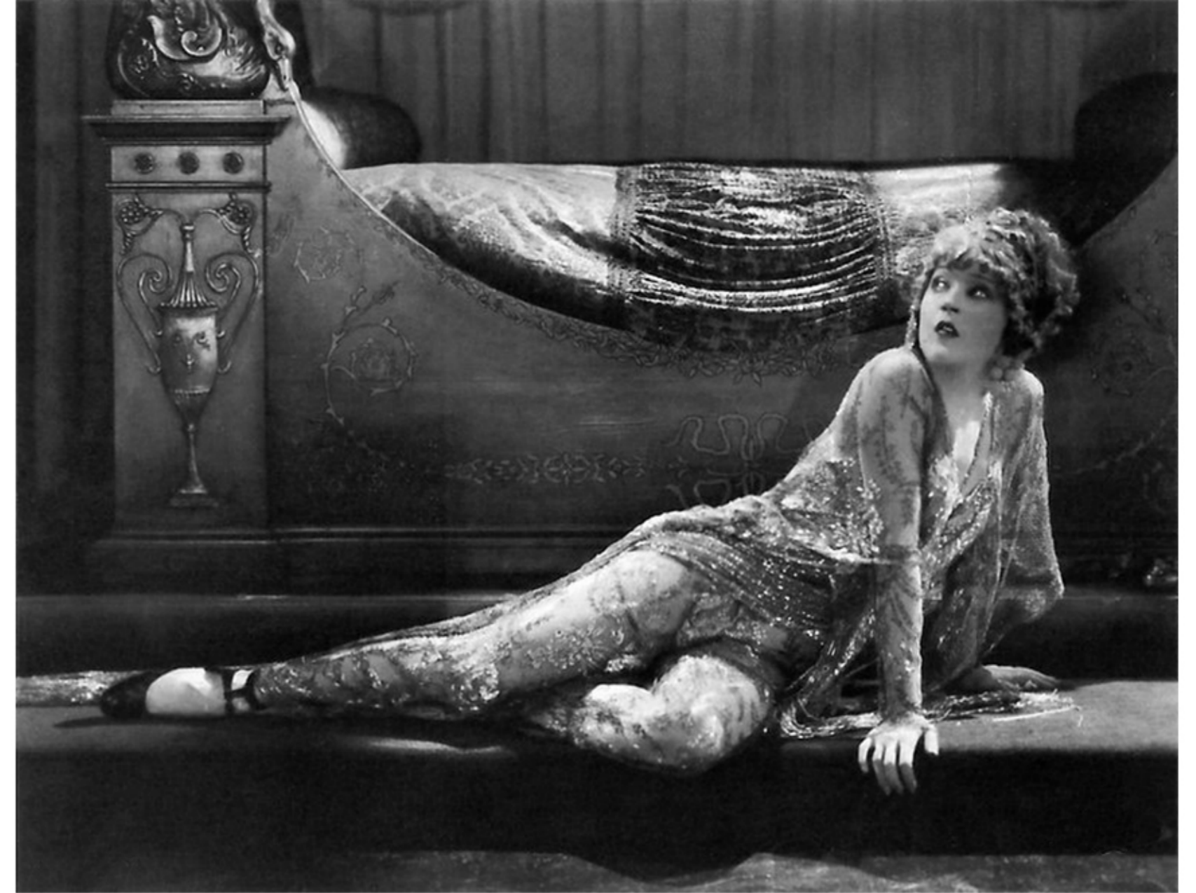
Mae Murray - nome d'arte di Marie Adrienne Koenig (1885 -1965)

The Big Sister , regia di John B. O'Brien (1916)