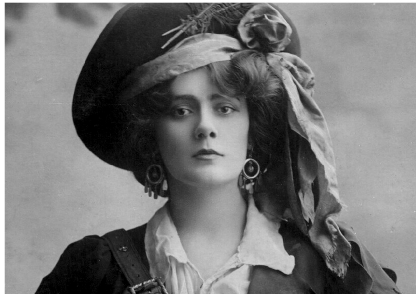
Lily Brayton - nome d'arte di Elizabeth Bryton (1876-1953)