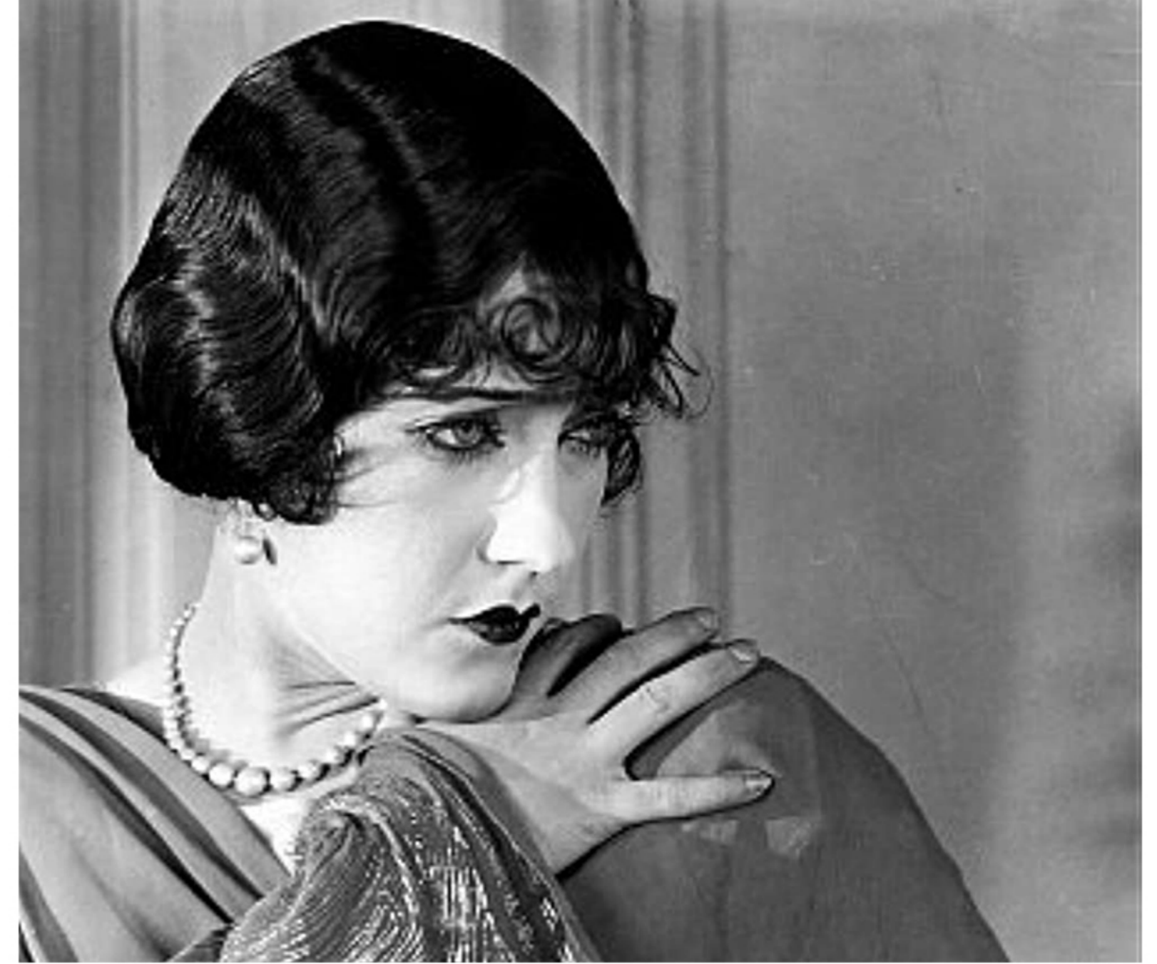
Gloria Swanson - nome d'arte di Gloria May Josephine Svensson (1899-1983)