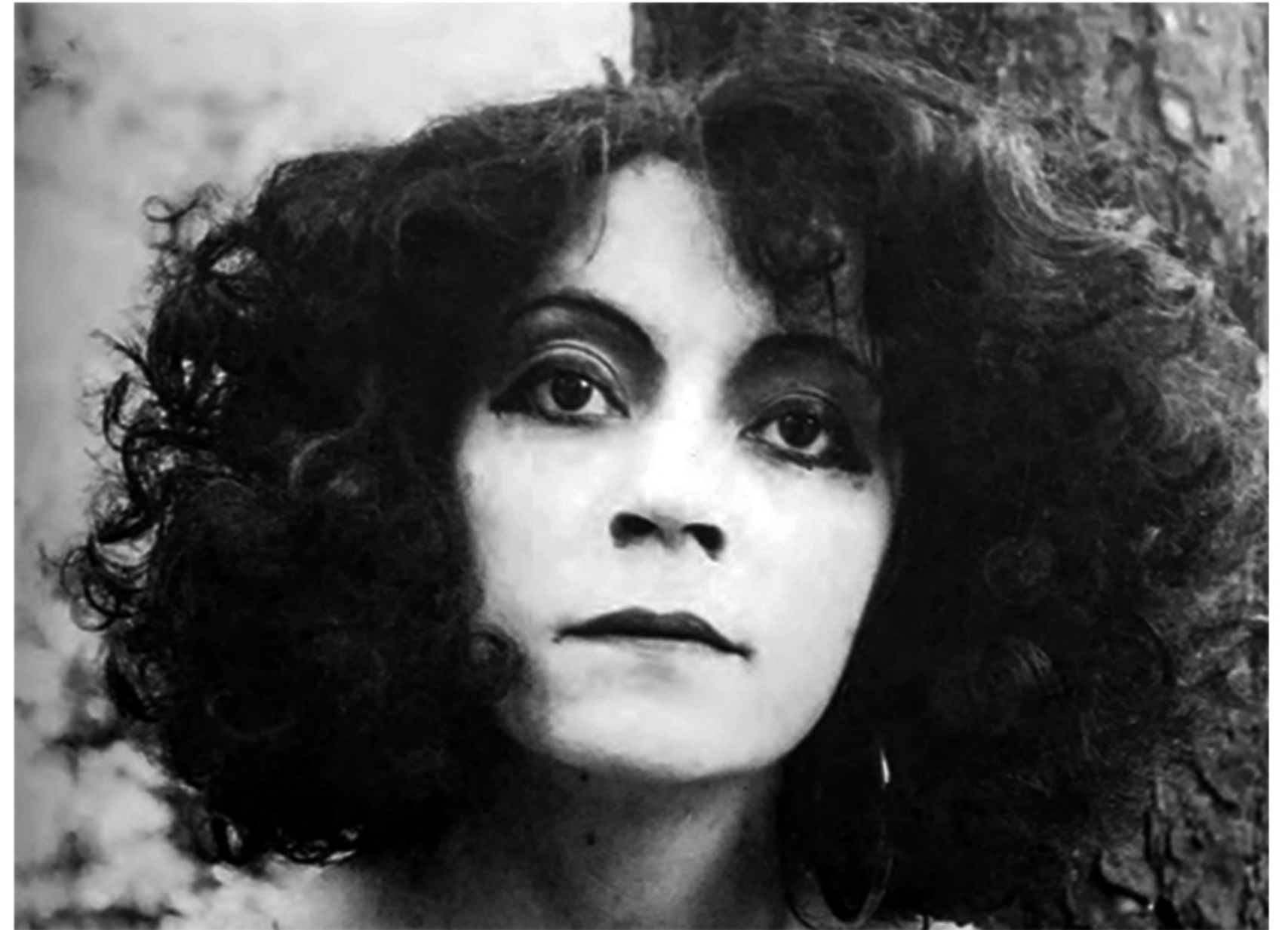
Asta Nielsen - nome d'arte di Asta Sofie Amalie Nielsen (1881-1972)

L'abisso (Afgrunden), regia di Urban Gad (1910)