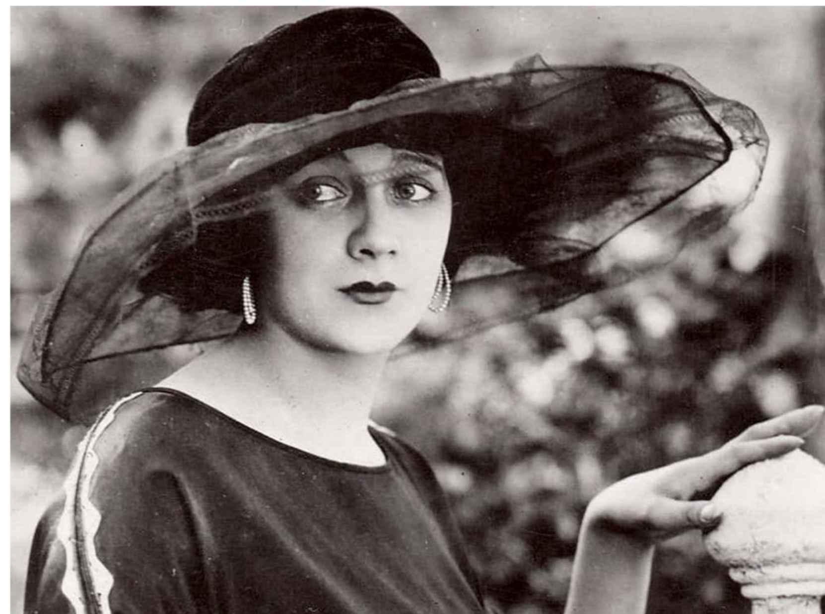
Barbara La Marr - nome d'arte di Reatha Dale Watson (1896 -1926)