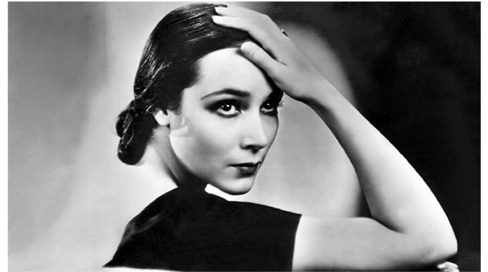
Dolores del Río - nome d'arte di Dolores Martínez Asúnsolo y López Negrete (1904 -1983)

Newport Beach , 11 aprile 1983), è stata un'attrice e ballerina messicana