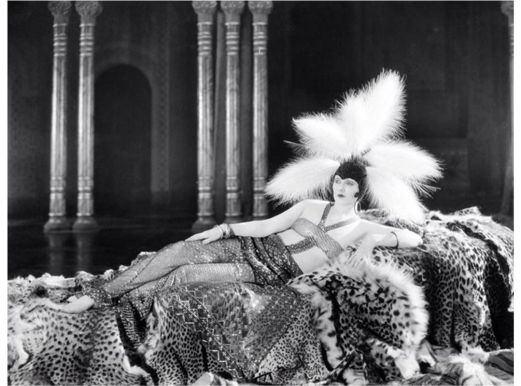
Betty Blythe - nome d'arte di Elizabeth Blythe Slaughter (1893-1972)

La regina di Saba (The Queen of Sheba), regia di J. Gordon Edwards (1921)