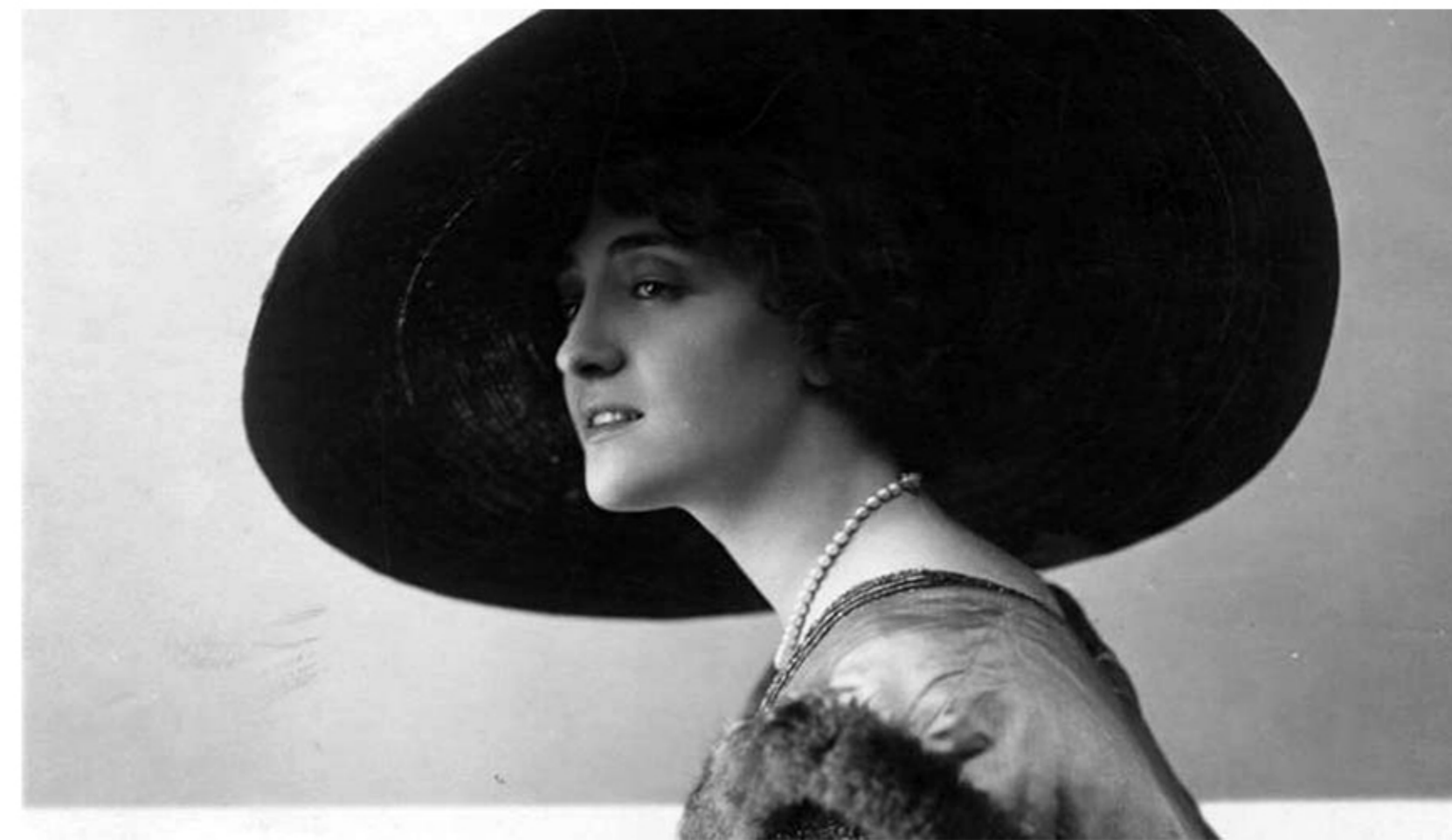
Lyda Borelli (1887-1959)

La donna nuda , regia di Carmine Gallone (1914)