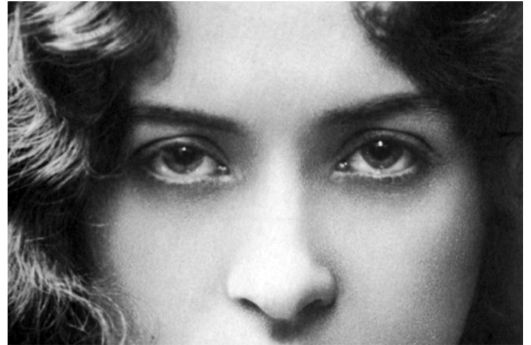
Valeska Suratt o Valeska Surrat (1882-1962)

L'immigrante (The Immigrant), regia di George Melford (1915)