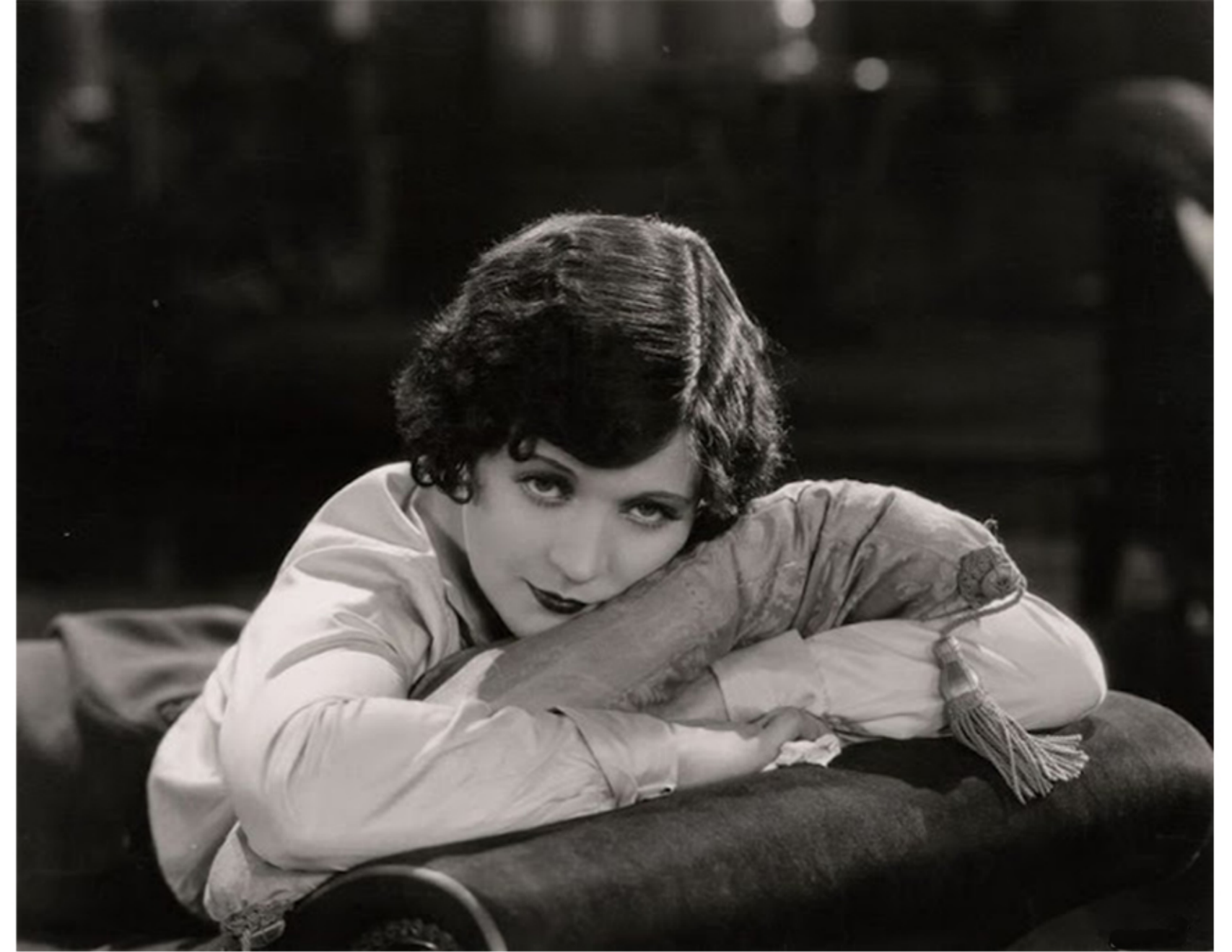
Marie Prevost - nome d'arte di Mary Bickford Dunn (1896-1937)