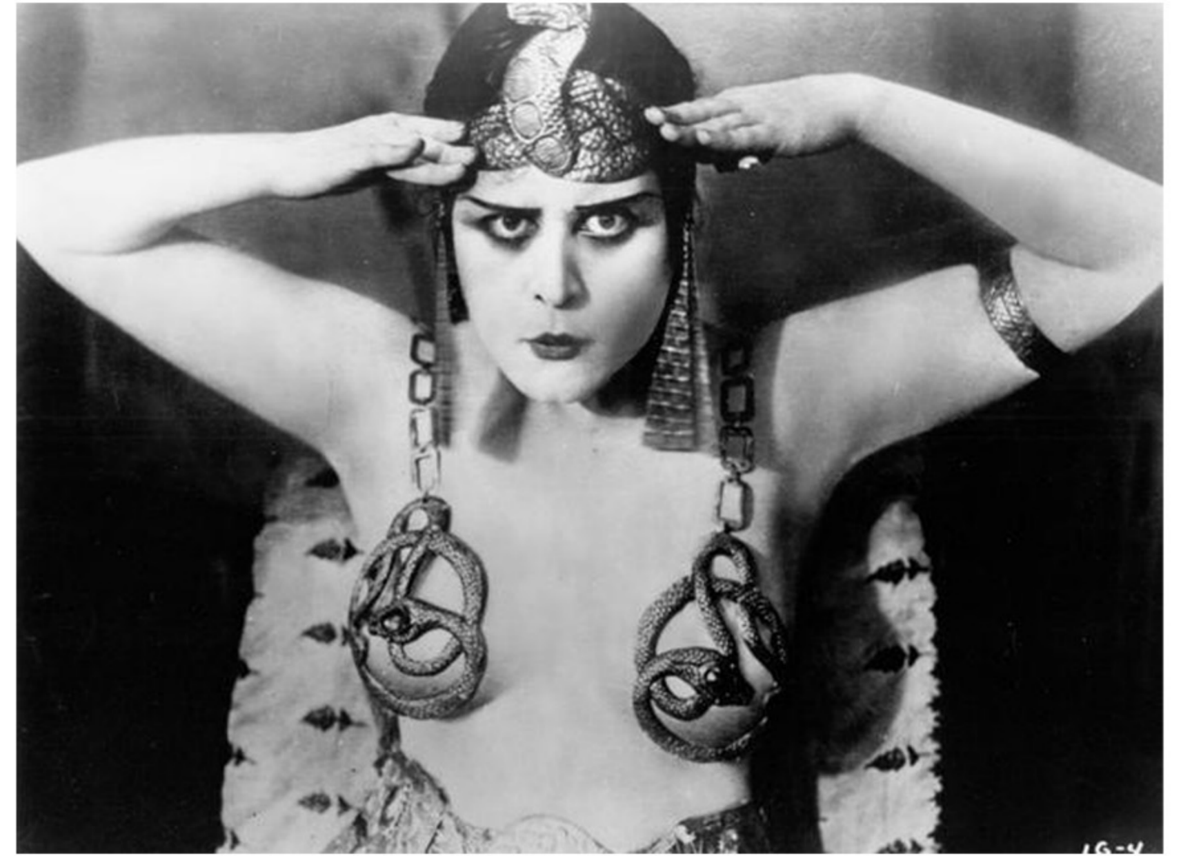
Theda Bara - nome d'arte di Theodosia Burr Goodman (1885 -1955)