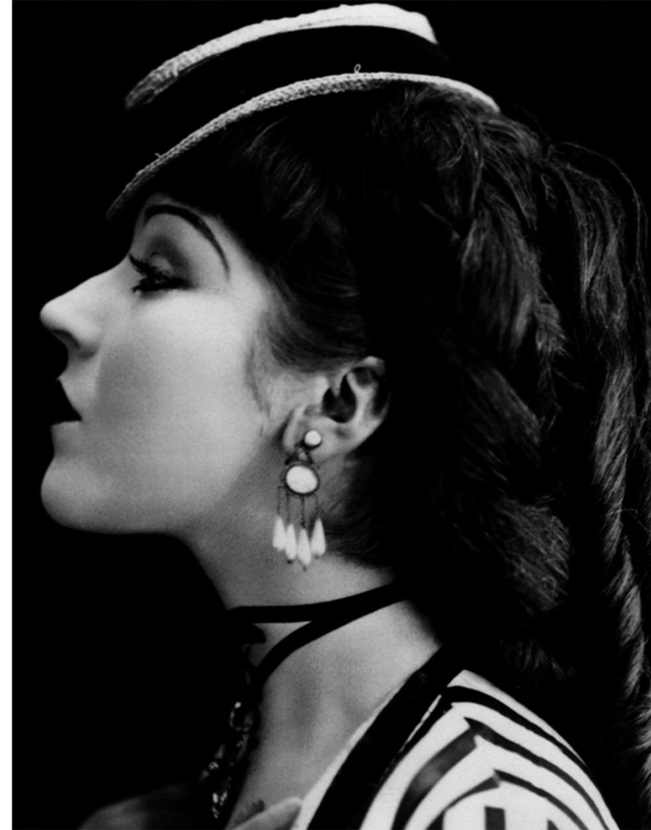
Catherine Hessling - nome d'arte di Andrée Madeleine Heuschling (1900-1979)

La ragazza dell'acqua (La fille de l'eau), regia di Jean Renoir (1925)